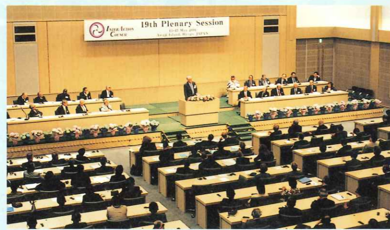
県民参加の開会式

新緑美しく、紫陽花が清楚に並ぶ淡路夢舞台国際会議場を舞台に、去る5月12日から15日の4日間、インターアクションカウンスル(OBサミット)の第19回総会が開催されました。首相・大統領経験者、国際政治経済の専門家ら計20カ国36人が出席。世界の平和及び発展に貢献することを目的に議論。「淡路声明」26項目を発表して閉幕しました。 討議に先立ち行われた地元主催歓迎レセプションで、メンバーは淡路人形浄瑠璃や子どもミュージカルを鑑賞。その他、明石海峡クルージングなど、淡路での安らぎのひとときを過ごしました。