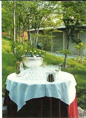
▲お茶室・庭園ワインパーティー