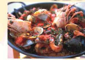
淡路の海鮮料理に舌鼓