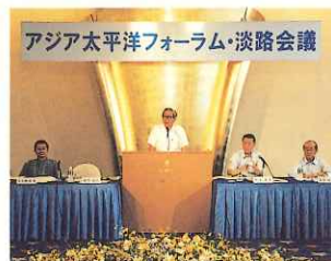
▲昨年開催の第1回会議

8月3、4日 「アジア太平洋の持続的 発展と環境」をテーマに 学者、研究者などが討議 3日、シンポジウムでは 川口順子環境大臣を迎え 基調講演