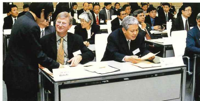
HUMAP (兵庫・アジア太平洋大学間交流ネットワーク) 協定調印式 5月19日

兵庫県とひょうご大学連携事業推進機構が提唱し、兵庫地域とアジア・太平洋地域の大学間交流システムの構築をめざす「HUMAP」の調印式が5月19日、当会議場で行われ、8カ国61大学の学長が協定書に署名しました。これに先立ち、当日は創設記念事業として「アジア・太平洋における知的協力の枠組みづくりに向けて」をテーマにした国際シンポジウムが開催されました。