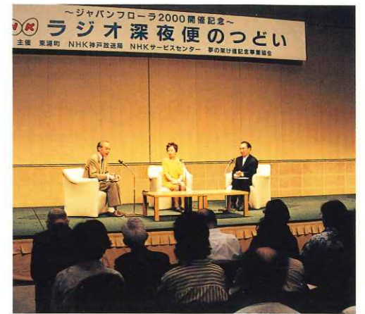
NHKラジオ深夜便のついで