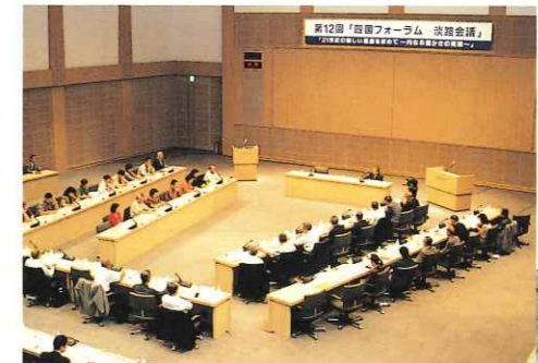
四国フォーラムー淡路会議