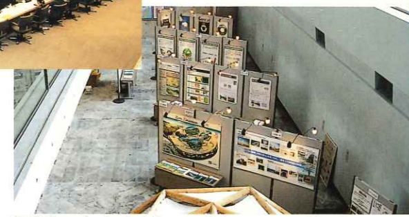
森のゼロエミッション交流フォーラム (ポスターセッション)