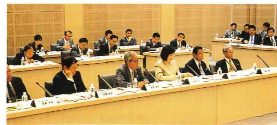
関西広域連携協議会理事会