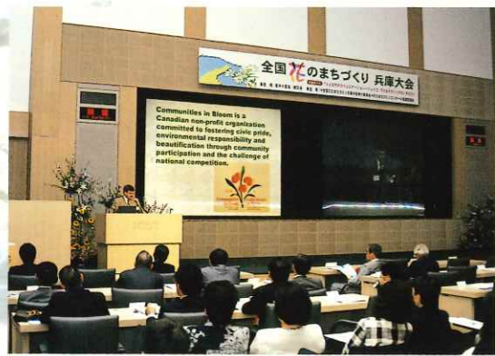
全国花のまちづくり 兵庫大会

兵庫県とひょうご大学連携事業推進機構が提唱し、兵庫地域とアジア・太平洋地域の大学間交流システムの構築をめざす「HUMAP」の調印式が5月19日、当会議場で行われ、8カ国61大学の学長が協定書に署名しました。これに先立ち、当日は創設記念事業として「アジア・太平洋における知的協力の枠組みづくりに向けて」をテーマにした国際シンポジウムが開催されました。