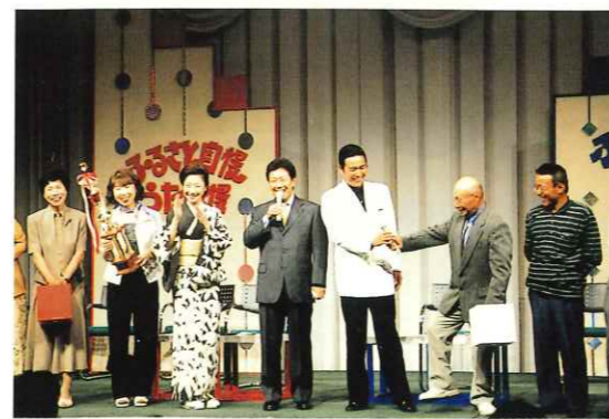
NHKふるさと自慢うた自慢