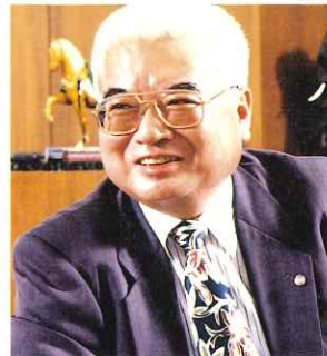
兵庫県立 淡路夢舞台国際会議場 館長

これから、当会議場が、未来につなぐ新しい文化の架け橋として、また人と人、人と自然とのコミュニケーションの拠点として時間とともに成長していくよう、全力を挙げてまいりますので、どうぞ今後ともご理解ご協力のほどよろしくごお願い申し上げます。