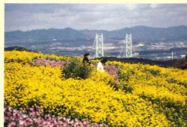
世界一の橋と花の淡路島