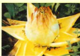
日本初公開も!世界から秘花・珍花が大集合