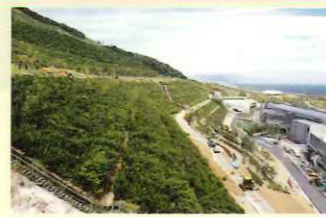
よみがえる大地、斜面に広がる「緑の大屏風」