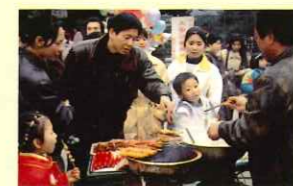
グルメ、ショッピング&ダンシング 「アジアショーケース」