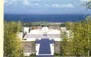
世界の花が集い、舞う「花文化の殿堂」 「花の館」