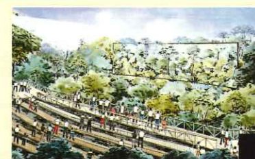
地上40メートル! 熱帯雨林の大パノラマ体験「緑と都市の館」