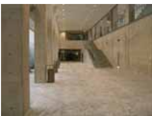
地下1Fロビーをまっすぐ進む