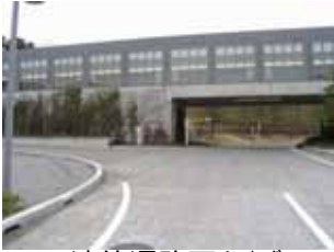
連絡通路下をくぐる。