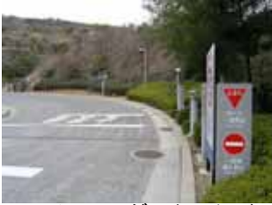
チェーンゲート、インターホンで 会場への搬入の旨、連絡。