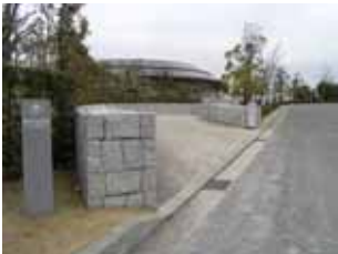
左手搬入口へ下る。